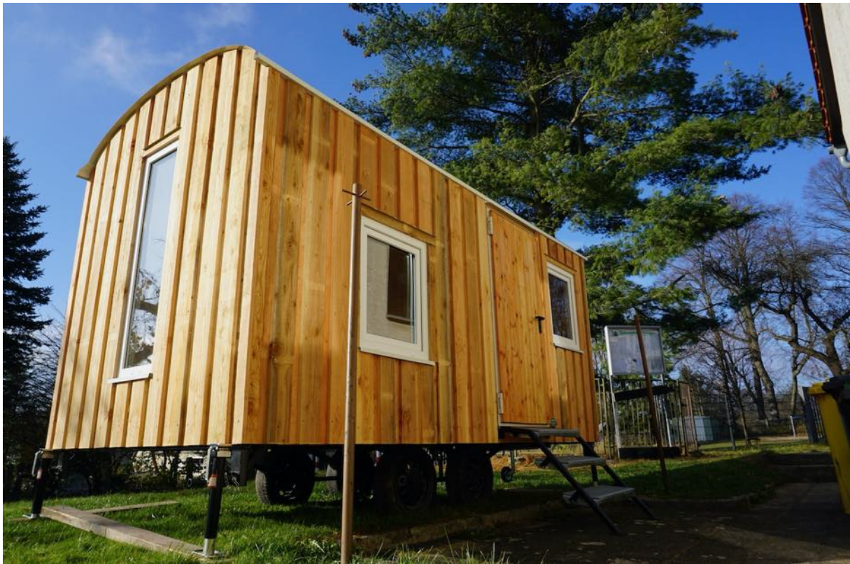
Bildquelle: Tino Michel

Quelle: https://www.vfbe-oberlichtenau.de